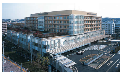
(川崎市立多摩病院)

研修期間中、聖マリアンナ医科大学病院においては、一般病棟等において感染性疾患・内分泌代謝疾患・血液疾患・腫瘍疾患・アレルギー疾患・呼吸器疾患・消化器疾患・腎泌尿器疾患・循環器疾患・神経疾患・遺伝性疾患など専門分野の診療、救命救急センター等において1次から3次までの救急診療、さらに2023年開設の小児集中治療室において小児集中治療、総合周産期母子医療センターにおいて新生児疾患の診療を担当医として研修します。聖マリアンナ医科大学横浜市西部病院においては、一般病棟等において主に急性疾患の診療、一般外来において common disease の診療、救命救急センター等において1次から3次までの救急診療、周産期センターにおいて新生児疾患の診療を担当医として研修します。川崎市立多摩病院においては、一般病棟等において主に急性疾患の診療、一般外来において common disease の診療、1次から2次までの救急診療の担当医として、さらに、神経疾患を中心とした在宅医療との連携も研修します。研修期間内に、概ね1年間を聖マリアンナ医科大学病院、6ヶ月間を聖マリアンナ医科大学横浜市西部病院と川崎市立多摩病院、1年間を聖マリアンナ医科大学病院総合周産期母子医療センター、あるいは聖マリアンナ医科大学横浜市西部病院周産期センターで、すべての領域を総合的に研修します。女性医師には、結婚、妊娠、出産などに際しても、安心して研修が継続可能な環境、さらに生涯にわたり小児科専門医として働くことが可能な環境を用意しています。