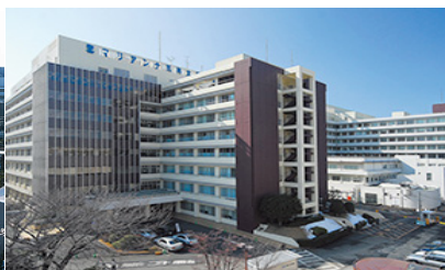
(聖マリアンナ医科大学病院)