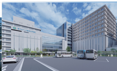
（聖マリアンナ医科大学病院）