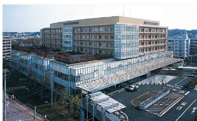
（川崎市立多摩病院）

研修期間中、聖マリアンナ医科大学病院においては、一般病棟等において感染性疾患・内分泌代謝疾患・血液疾患・腫瘍疾患・アレルギー疾患・呼吸器疾患・消化器疾患・腎泌尿器疾患・循環器疾患・神経疾患・遺伝性疾患など専門分野の診療、救命救急センター等において1次から3次までの救急診療、さらに小児集中治療室（PICU）において小児集中治療、総合周産期母子医療センター（NICU）において新生児疾患の診療を担当医として研修します。聖マリアンナ医科大学横浜市西部病院においては、一般病棟等において主に急性疾患の診療、一般外来において common disease の診療、救命救急センター等において1次から3次までの救急診療、周産期センターにおいて新生児疾患の診療を担当医として研修します。川崎市立多摩病院においては、一般病棟等において主に急性疾患の診療、一般外来において common disease の診療、1次から2次までの救急診療の担当医として、さらに、神経疾患を中心とした在宅医療との連携も研修します。研修期間内に、2年間を聖マリアンナ医科大学病院、（PICU/NICU 研修を含む）、残る1年間をそれぞれ半年ずつ聖マリアンナ医科大学横浜市西部病院と川崎市立多摩病院で、すべての領域を総合的に研修します。男性医師には育児休暇、女性医師には、結婚、妊娠、出産などに際しても、安心して研修が継続可能な環境、さらに生涯にわたり小児科専門医として働くことが可能な環境を用意しています。